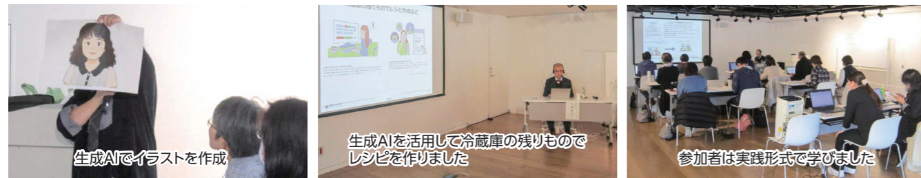
生成AIでイラストを作成

場所 市民交流センターtette ルーム1-1 日にち 令和7年11月12日(水)