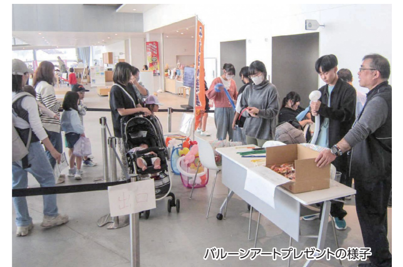
バルーンアートプレゼントの様子

場所 市民交流センターtette、翠ヶ丘公園エリア 日にち 令和7年10月12日(日)